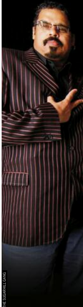
THE SUGARHILL GANG

Moe. Standard Time Quartet. 21:30h. 4€. (Jazz)