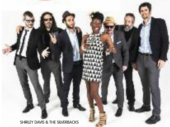
SHIRLEY DAVIS & THE SILVERBACKS

En octubre y noviembre vuelve la segunda oleada del 2016 del ciclo Coca-Cola Concerts Club a las salas de Madrid, y ya tenemos los 4 grupos ganadores de nuestro concurso de bandas!! Que da la oportunidad a bandas emergentes empiecen a girar por las salas más conocidas de Madrid y de la mano de grupos ya relevantes del circuito, con una gran campaña de promoción que te ofrece Coca-Cola donde aparecen en cartelera, cuñas de radio, anuncios en prensa... Para este otoño, las bandas ganadoras son THE HITTERS , TOMACCOS , THE FLAMING DOLLS y OREJAS DE MONO que han sido los 4 grupos seleccionados entre los más de 180 grupos que se han presentado, para acompañar en el escenario a SHIRLEY DAVIS & THE SILVERBACKS , JAZZ SISTERS , THE VAL y VIKXIE . Estate atento a esta nueva cita de los Coca-Cola Concerts Club!!! www.lanocheenvivo.com