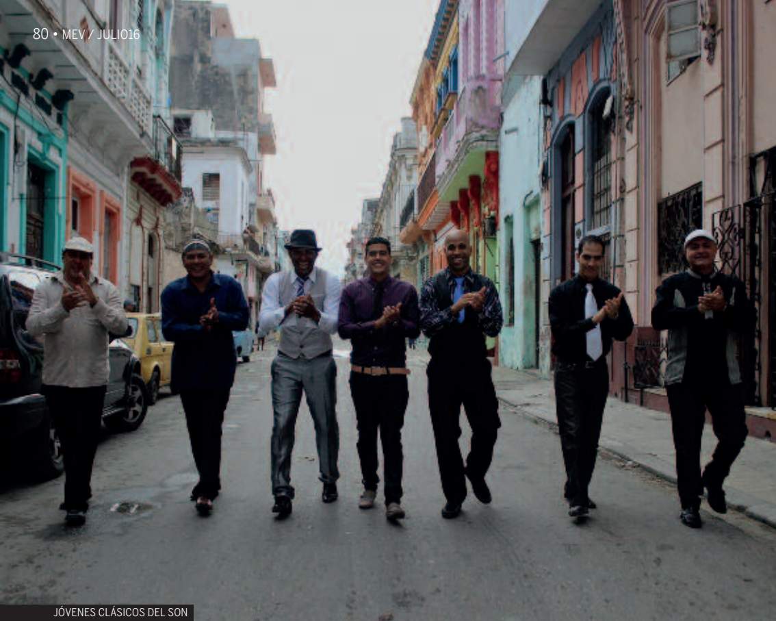
JÓVENES CLÁSICOS DEL SON