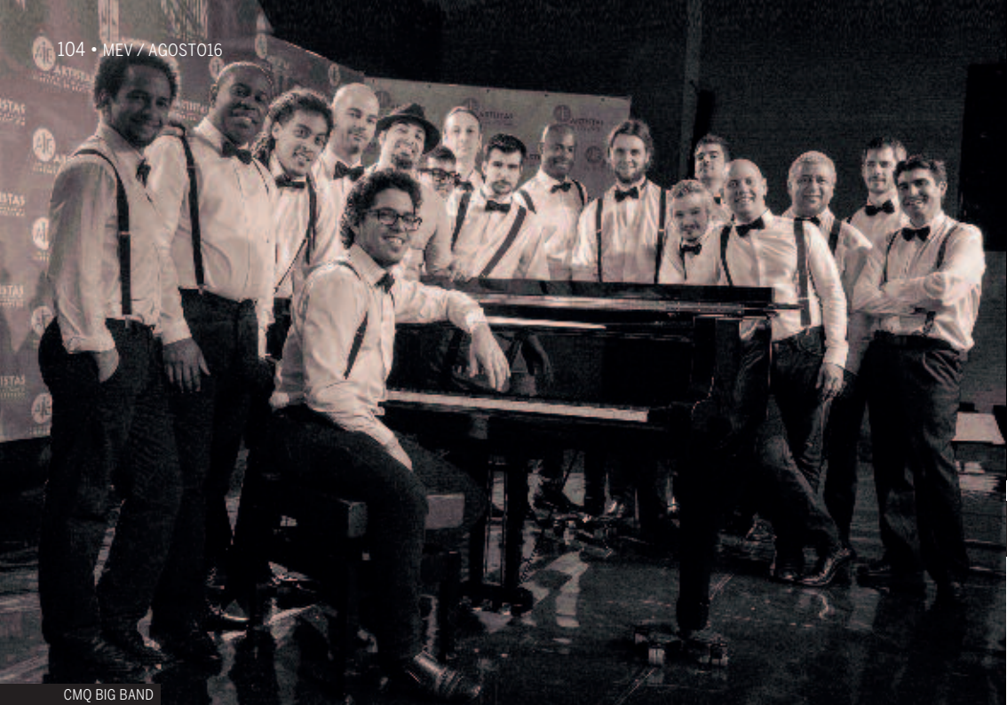
CMQ BIG BAND