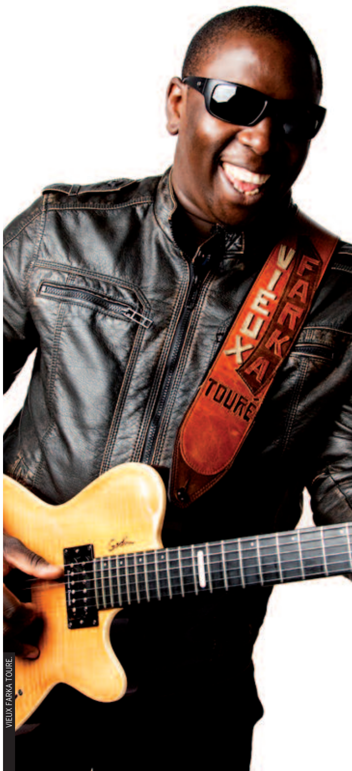
VIEUX FARKA TOURE.