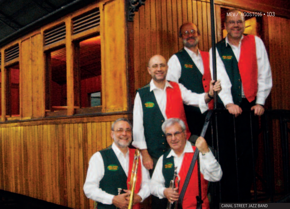
CANAL STREET JAZZ BAND