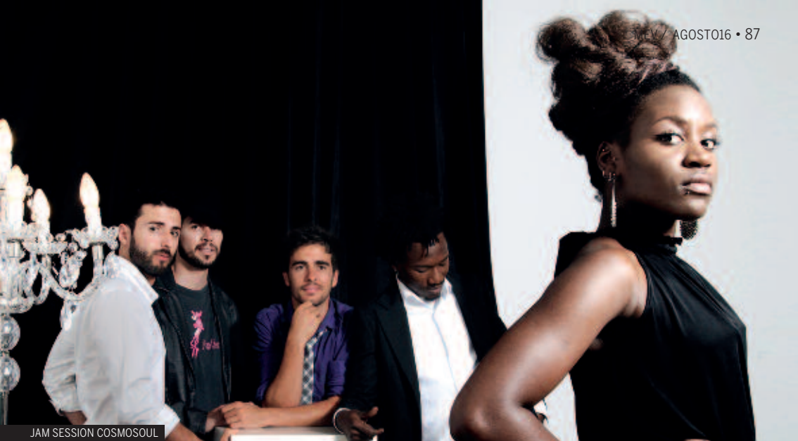
JAM SESSION COSMOSOUL