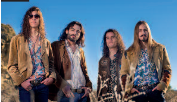
El Viaje de Eliot