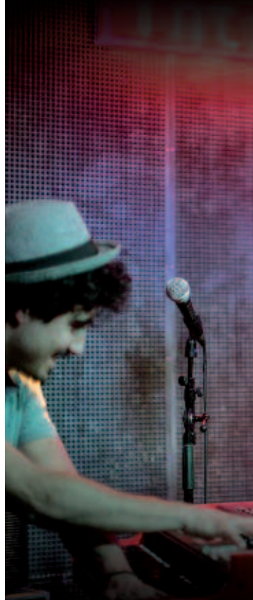
THE MIGHTY VAMP BY JAIME MASSIEU

Moe. Trembling Shoes. 22:00h. Entrada libre. (Blues)