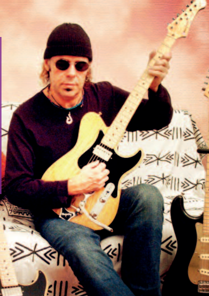
VARGAS BLUES BAND