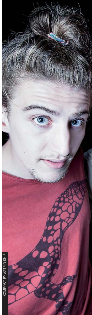
KOMPOST BY ASTRID KNIE

Fulanita de tal. Xabier Leguina. 21:30h. 8€ con consumición. (Pop)