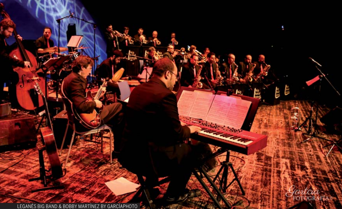
LEGANÉS BIG BAND &amp; BOBBY MARTÍNEZ