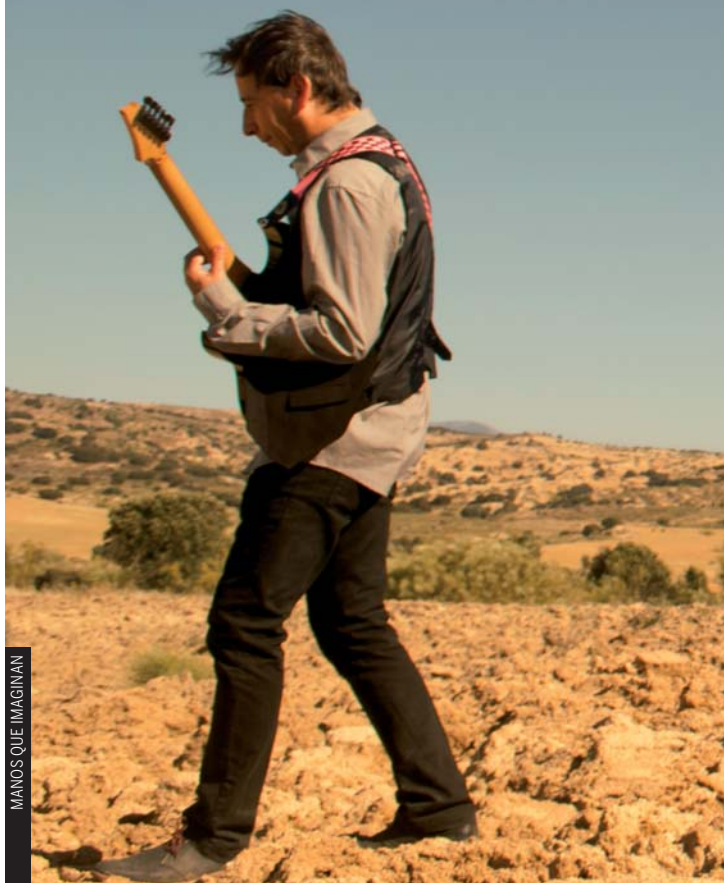
MANOS QUE IMAGINAN

Manos Que Imaginan presenta su disco 'Tierra Quemada', una colección de composiciones propias en estilo Jazz Rock. Cada tema tiene su propia personalidad además de beber de múltiples fuentes, desde el rock progresivo hasta la bossanova o el Funk, pasando por el Drum 'n' Bass y con un telón de fondo de armonías contemporáneas.