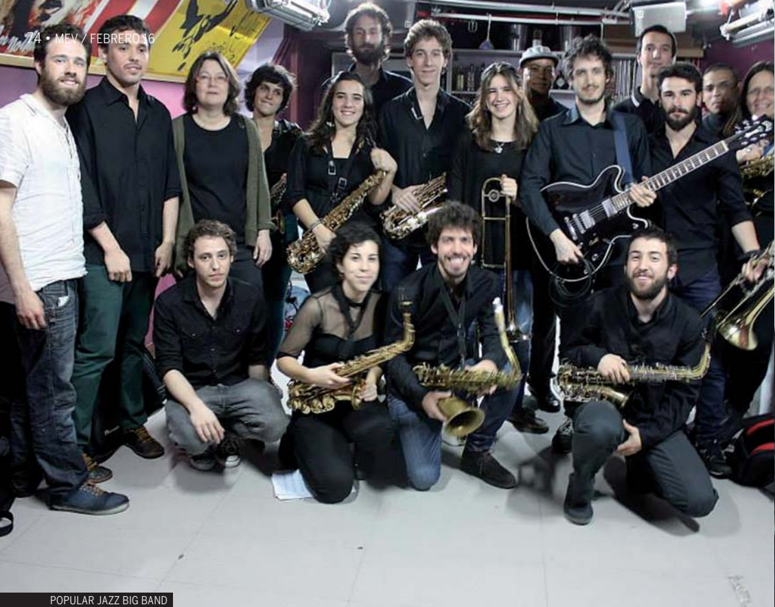
POPULAR JAZZ BIG BAND