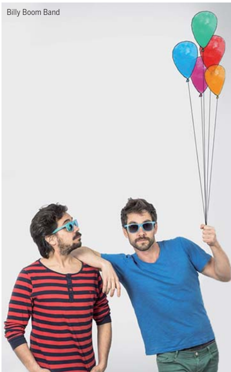
Billy Boom Band