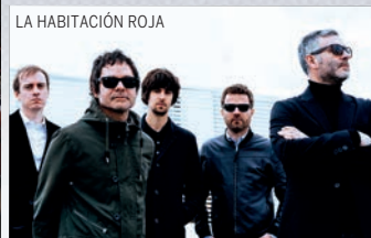
LA HABITACIÓN ROJA