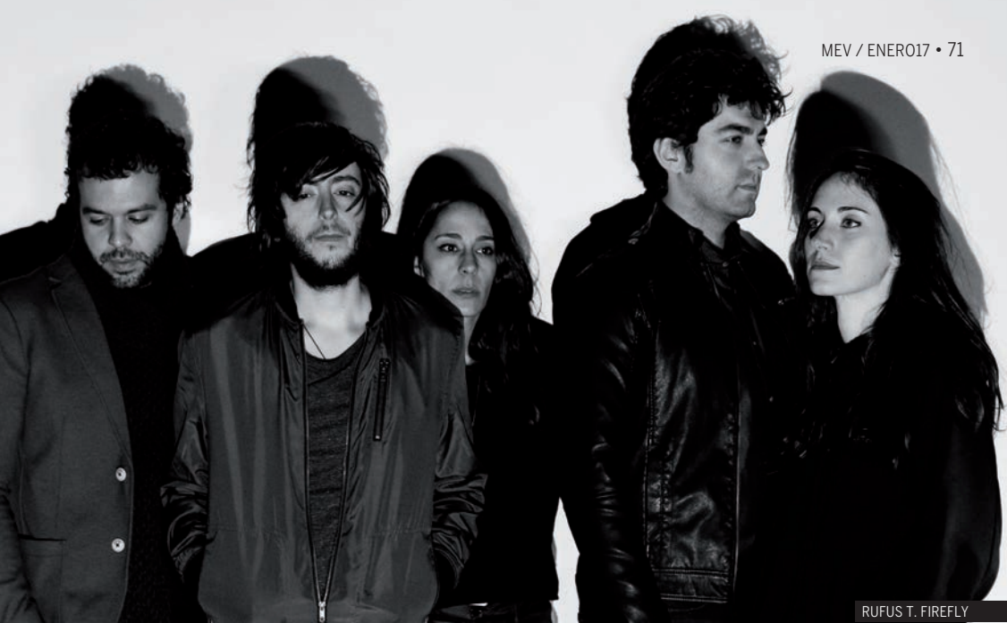
RUFUS T. FIREFLY